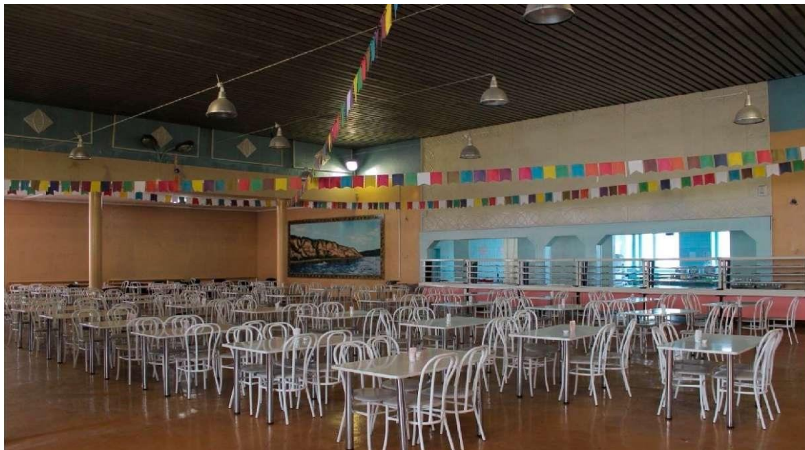
Рис. 2 – столовая УИВТ

На оказание услуг питания для курсантов заложена сумма 30000000 рублей в год.